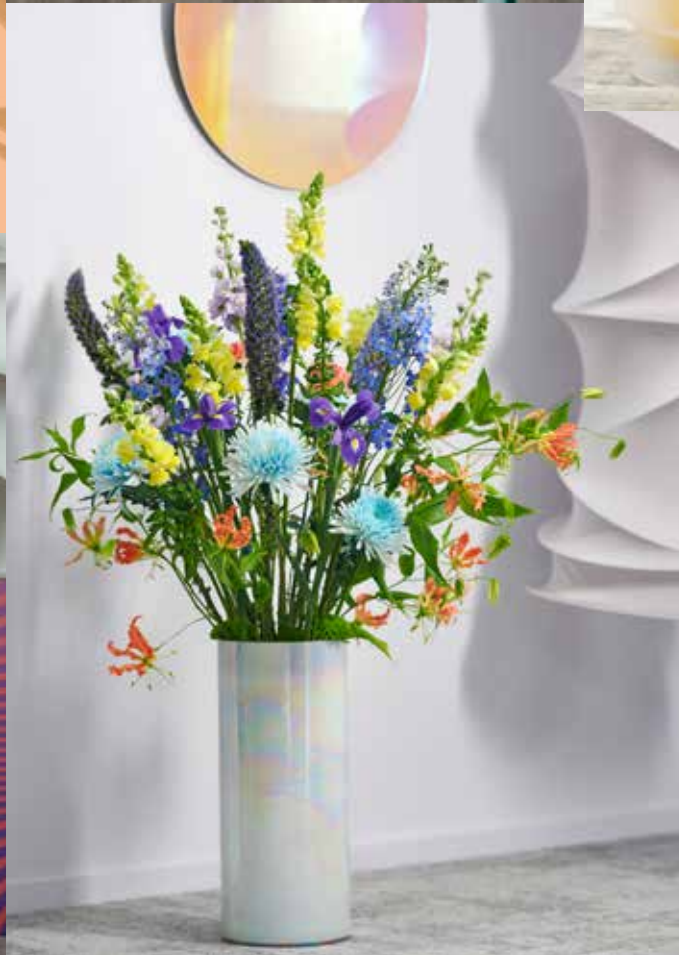
Opvallend en contrastrijk kleurgebruik geeft energie.