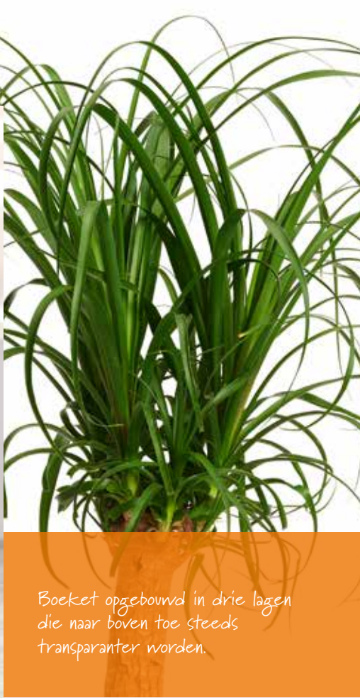
Boeket opgebouwd in drie lagen die naar boven toe steeds transparanter worden.